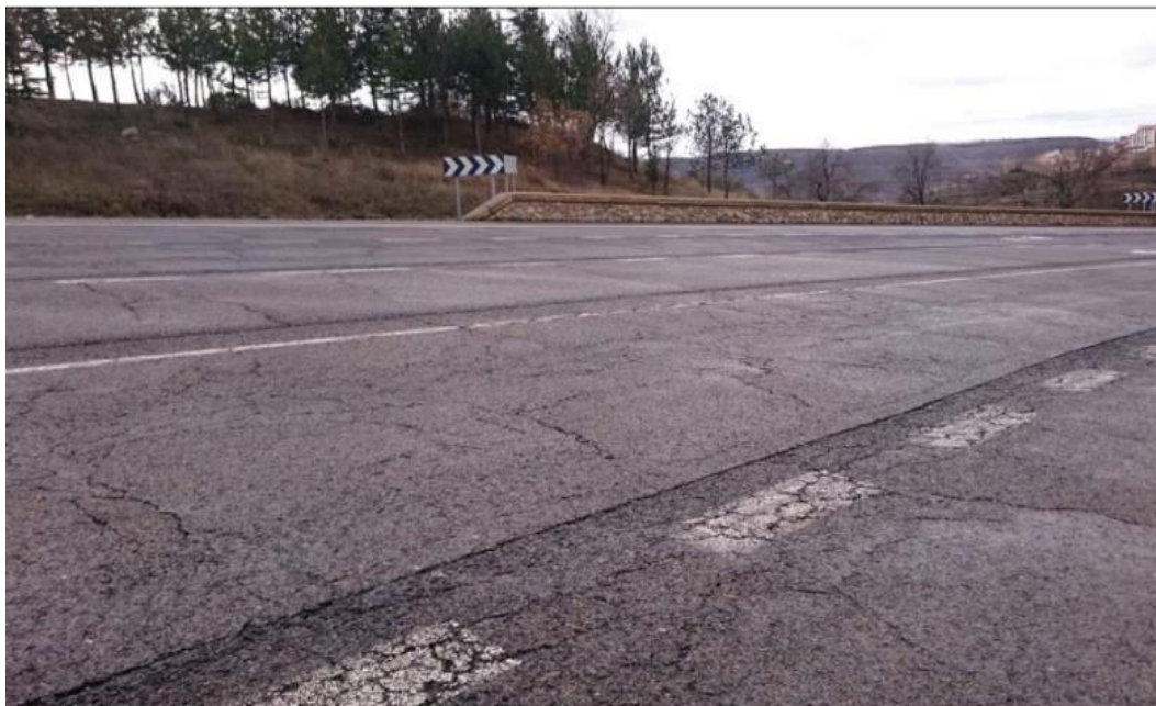
P.K. 63+500 MI: Cuarteos en malla fina. Grietas longitudinales. Grietas erráticas

MINISTERIO DE TRANSPORTES, MOVILIDAD Y AGENDA URBANA